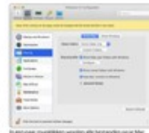
In een paar minuten worden alle bestanden op je Mac beschikbaar voor Windows.

Wanneer je vaak werkt tussen Windows en Mac is het vaak handig om je bestanden op een centrale plaats te plaatsen (in plaats van plaatsen op de Mac). Via een eenvoudige instelling wordt er een virtuele Windows-bestand op je Mac kan worden geplaatst. Het is belangrijk om de software te installeren op de Mac, want de software is niet beschikbaar op andere besturingssystemen.