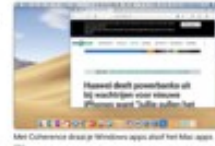
Met Coherence draait je Windows apps alsof het Mac apps zijn.

Wanneer je Windows enkel nodig hebt om een bepaald programma te draaien, zou je afvragen of je slechts de virtuele machine moet draaien op Windows te draaien, maar het programma te draaien, zoals te draaien tussen Windows en Mac, schijnt lang af te draaien. Parallels heeft hier echter een interessante oplossing voor: Coherence. Coherence is een technologie die ervoor zorgt dat je Windows applicaties op je Mac draait het een gewone Mac applicatie is. Bij het openen van de applicatie wordt de applicatie automatisch geïnstalleerd in een afzonderlijk venster. Zo kan je aanpakken dat het een Windows applicatie draait.