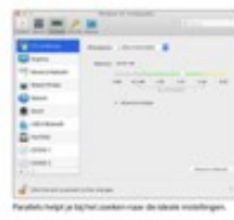
Parallels helpt je bij het aanpassen van de virtuele machine.

Na het downloaden van de nieuwste versie van Parallels Desktop 14, moet je de software installeren op de Mac. Het is belangrijk om de software te installeren op de Mac, want de software is niet beschikbaar op andere besturingssystemen. Het is belangrijk om de software te installeren op de Mac, want de software is niet beschikbaar op andere besturingssystemen.